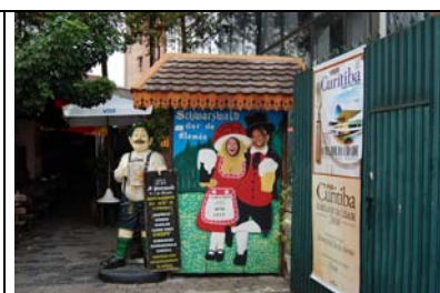
Auffassung deutscher Kultur