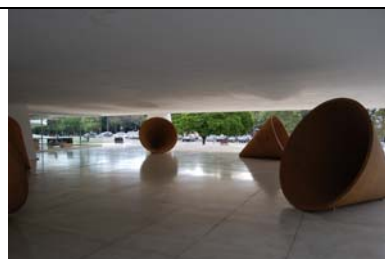
Museum Oscar Niemeyer