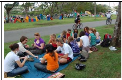
Treffen mit Jugendgruppe