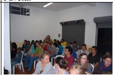
Favela Barigüi im Projekt