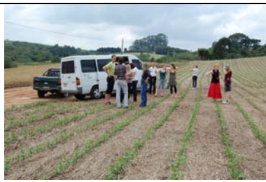
ökologische Initiative Witmarsum