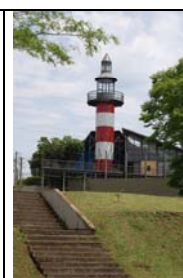
kommunale Bildungseinrichtung in Favelas