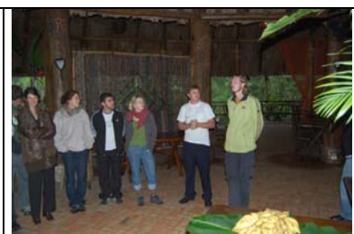
Regenwaldtrail bei Morrettes