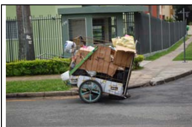
Handwagen eines Müllsammlers