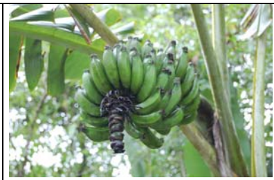
das Beispiel Banane